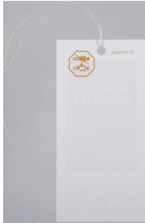
Abb./Fig. 2: Ersatzteilhänger Rückseite/Spare parts tag, back side/face arrière de l'étiquette de pièce de rechange/parte trasera de la etiqueta del repuesto