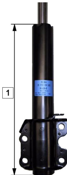
Abb. 1: Vorderachse

Art.-Nr.: 124 654, 290 377, 290 378, 290 379, 290 403, 290 955