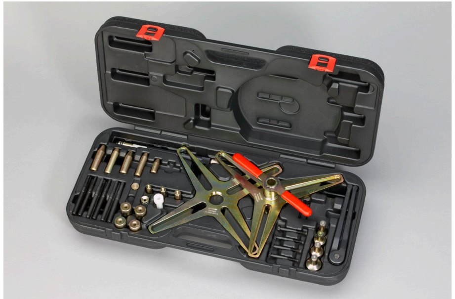
Bild 2: 400 0237 10 - Der neue Koffer mit erweitertem Inhalt

Die zusätzlichen Werkzeuge (siehe Bild 3, 5 und 7) sind als Ergänzung zum bisherigen Koffer auch einzeln erhältlich.