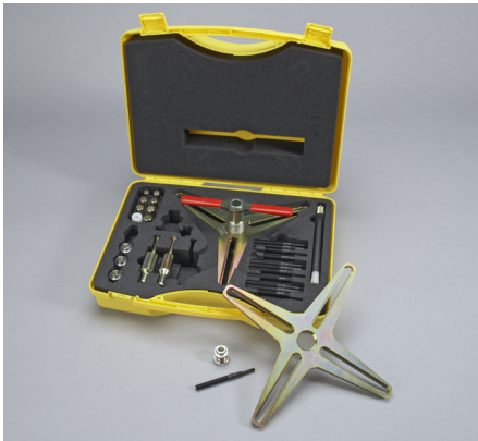
Bild 1: 400 0072 10 - bisheriger Koffer

Der bisher angebotene SAC-Werkzeugkoffer mit der Teile-Nr. 400 0072 10 ist nicht mehr lieferbar und wird durch einen neuen Koffer (Teile-Nr. 400 0237 10) mit zusätzlichem Inhalt ersetzt.