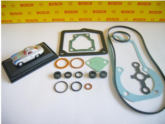
Abbildung beispielhaft, Modellfahrzeug ist nicht Bestandteil des Teilesatz