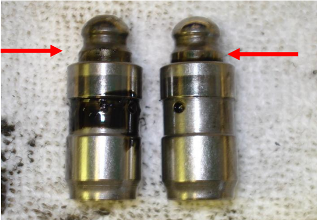
Bild 3: Hydrostößel li. maximal ausgefahren, Ventile dichten nicht - Stößel ersetzen