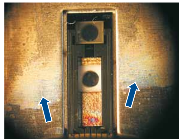
Die Folgen einer Reinigung mit Druckluft

Links: Die Folie, auf der die Sensorelemente aufgetragen sind, wurde von Partikeln regelrecht „zerschossen“.