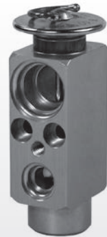
▲ VEMO-Nr. V20-77-0013 | X-Ref 64 11 8 362 851