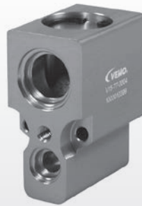
▲ VEMO-Nr. V15-77-0004 | X-Ref 6N0 820 679 C

Bedingt durch automatisierte Fertigungsprozesse sowie individuelle Funktionsprüfungen ist ein sehr hohes Qualitätsniveau sichergestellt. Expansionsventile der Qualitätsmarke VEMO zeichnen sich durch hohe Passgenauigkeit, maximale Funktionssicherheit und lange Lebensdauer aus.