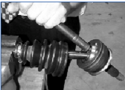
Ausbau des Originalgelenks

Um den Austausch zu erleichtern, werden Gleichlaufgelenke von Blue Print mit dem inneren Sprengring, einer hochwertigen Manschette, zwei Stahlclips für die Manschette, Befestigungsmutter und Sicherungsstift sowie 100 g des richtigen Schmierfetts geliefert.