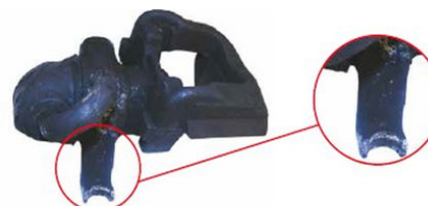
Aufnahme Seilzug defekt / mounting cable defect