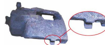
Befestigung gebrochen / mounting broken bracket