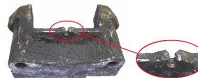
Aufnahme gebrochen / mounting broken