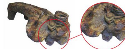
Starke Korrosion / strong corrosion