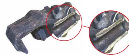
Gehäuse gebrochen / housing broken