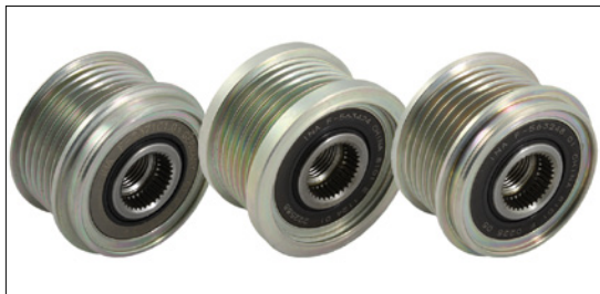
Bild 2: Generatorfreiläufe 535 0063 10 (links), 535 0202 10 (mitte), 535 0203 10 (rechts)

Bei oben genannten Fahrzeugen mit starrer Generatorriemenscheibe kann es zu Vibrationen und störenden Geräuschen aus dem Nebenaggregatetrieb kommen. Diese entstehen durch die, im Vergleich zum Benzinmotor, stärkeren Drehungleichförmigkeiten des Dieselmotors.