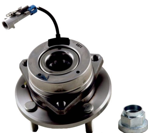
OE Referenz 96639585 R190.06

Der Einbau des falschen Radlagers verursacht ein defektes ABS-Signal. Eine visuelle Prüfung ist notwendig, um das richtige Radlager zu ermitteln. Dabei gilt: das Radlager mit der Metallabdeckung entspricht das NTN-SNR Kit R190.06.