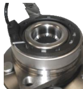
OE Referenz 96812619 R190.23