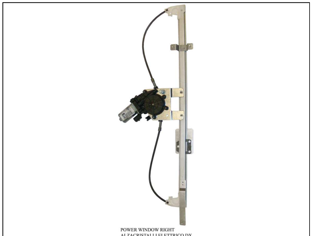
POWER WINDOW RIGHT ALZACRISTALLI ELETTRICO DX

THIS INSTALLATION INSTRUCTION IS FOR BOTH LEFT AND RIGHT SIDE. CETTE INSTRUCTION DE MONTAGE EST POUR LES DEUX COTES DROIT ET GAUCHE. DIESE MONTAGE-ANLEITUNG IST FÜR DIE BEIDE LINKE UND RECHTE SEITE. ESTA INSTRUCCION DE MONTAJE ES PARA LOS DOS LADOS IZQUIERDO Y DERECHO. LA PRESENTE ISTRUZIONE VALE SIA PER IL LATO SINISTRO CHE PER IL LATO DESTRO.