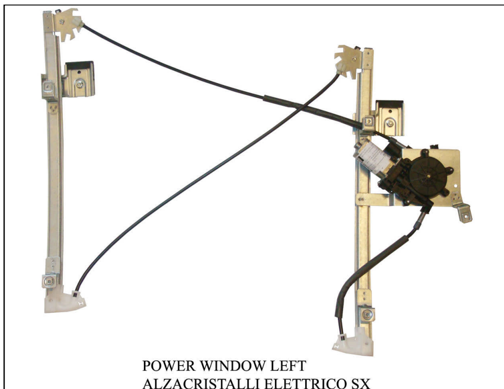
POWER WINDOW LEFT

LA PRESENTE ISTRUZIONE VALE SIA PER IL LATO SINISTRO CHE PER IL LATO DESTRO.