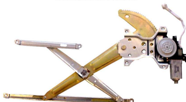
ORIGINAL POWER WINDOW LEFT ALZACRISTALLI ELETTRICO ORIGINALE SX